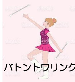
バドントワリング