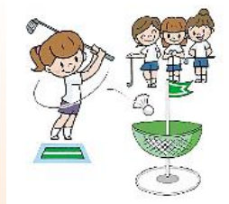
ターゲットバードゴルフ