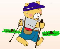
ノルディックウォーク