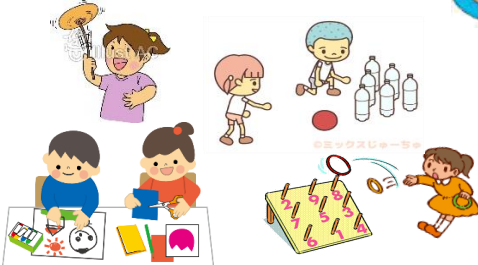
あそびの玉手箱/クラフト